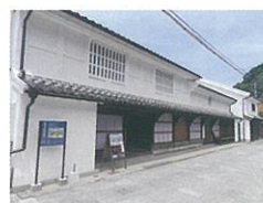
鯨組主 中尾家屋敷

主催 公益財団法人 唐津市文化事業団 Karatsu City Cultural Foundation