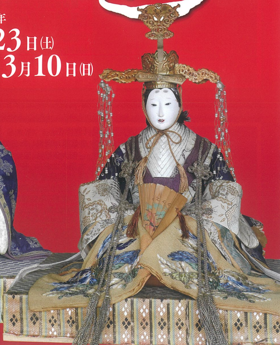
■写真のおひな様(古今雛)は、旧唐津銀行に展示しています。